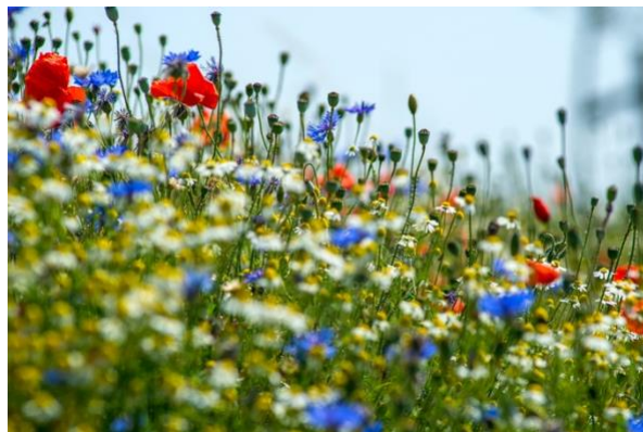
Afbeelding 1 en 2: voorbeelden van projecten met een biodiversiteitstoename (bloemrijke graslandranden)