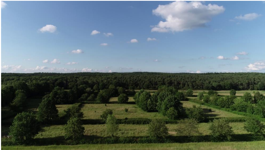
Afbeelding 3: Voorbeeld van kleinschalig compensatielandschap De Banen waarbij VNC betrokken is

Naast de afstemming over het proces zal er tijdens de eerste reeks bijeenkomsten een dialoog worden gevoerd met direct omwonenden, projectontwikkelaars en VNC om tot een eerste houtskoolschets van het plan te komen. Op basis van de belangen, wensen en eisen van de bovengenoemde partijen en de uitkomst van het veldbezoek en de 0-meting van het gebied worden de eerste kaders en randvoorwaarden voor het ontwerp van het casco landschap met daarin het zonnepark bepaald.